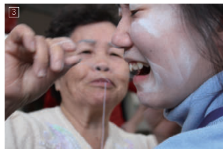
1.可愛的老頑童阿婆。 2.傳統客家福菜製作體驗。 3.體驗挽面的夥伴痛得大叫。 4.阿婆正仔細地檢查蒸籠裡的排氣孔，準備要炊蘿蔔糕。

大夥兒面面相覷後，忍不住相視而笑——這可是個難得的體驗哪！於是便爭先恐後地報名想要「踩菜」。紛紛脫鞋洗腳，踩進那