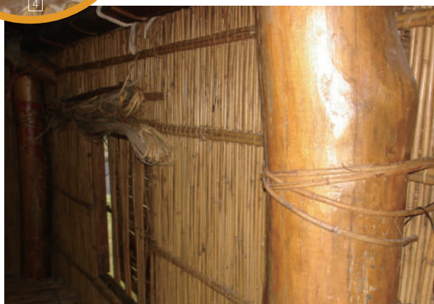
4.山羌皮 5.茅草屋頂 6.烏心木 7.茅草屋的白天景緻