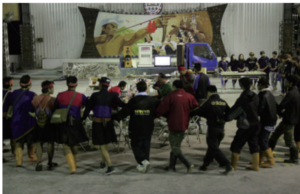
拜訪金崙部落友好同歡