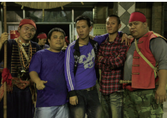
金崙部落與拉勞蘭部落青年會幹部