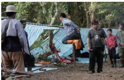
入會儀式：跳過火堆