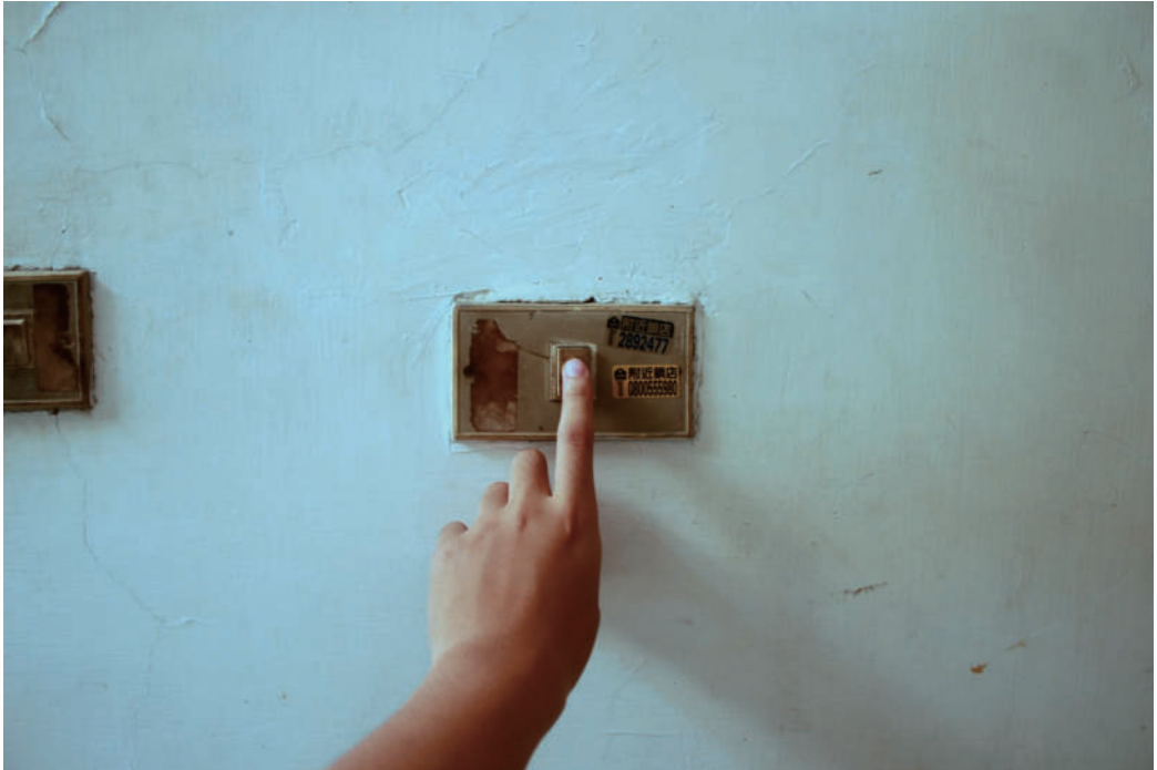
4. 阿白四號 這是第四個搬到隔壁的阿白，我很喜歡跟她聊天，過了一陣子，她問我要不要跟她隔壁的阿白一起聊天，我說太遠了我聽不到，後來就這樣了。