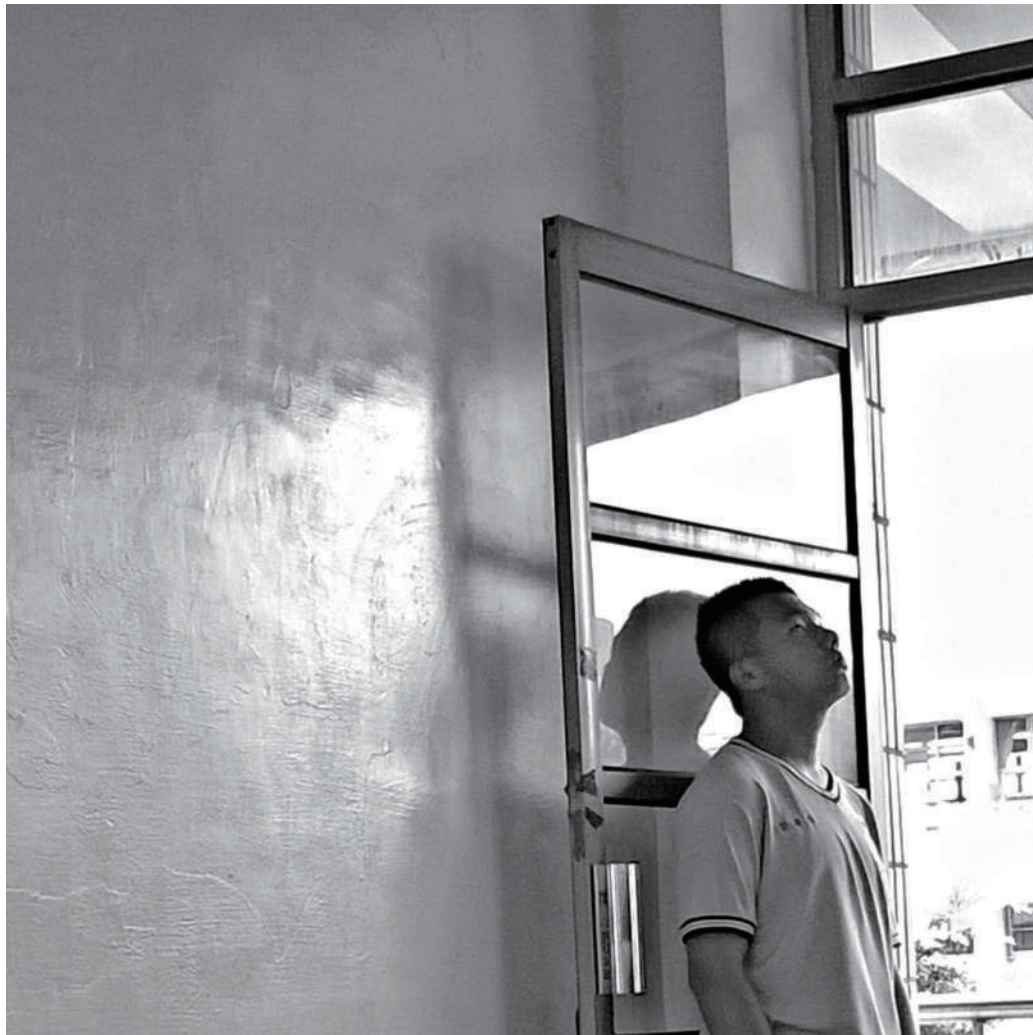
1.鬆口氣 這樣的生活總是讓人感到疲憊。

「人生最大的悲傷，是沒有說再見，而攝影是學會說再見。」雖然還有好多想說的話還沒對他們說，不過我想我已經好好的向他們說了再見，就留著下次見面再說吧！