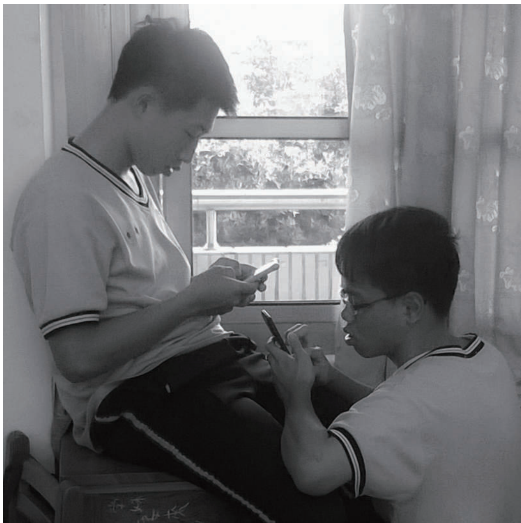
3.親密 這是最近的距離也是最遙遠的。