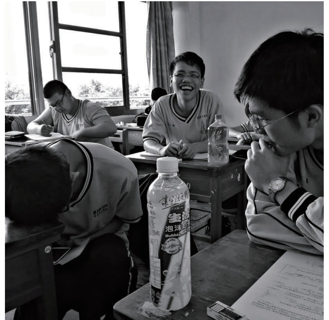
2.玩遊戲 我們主要的互動來自於它。