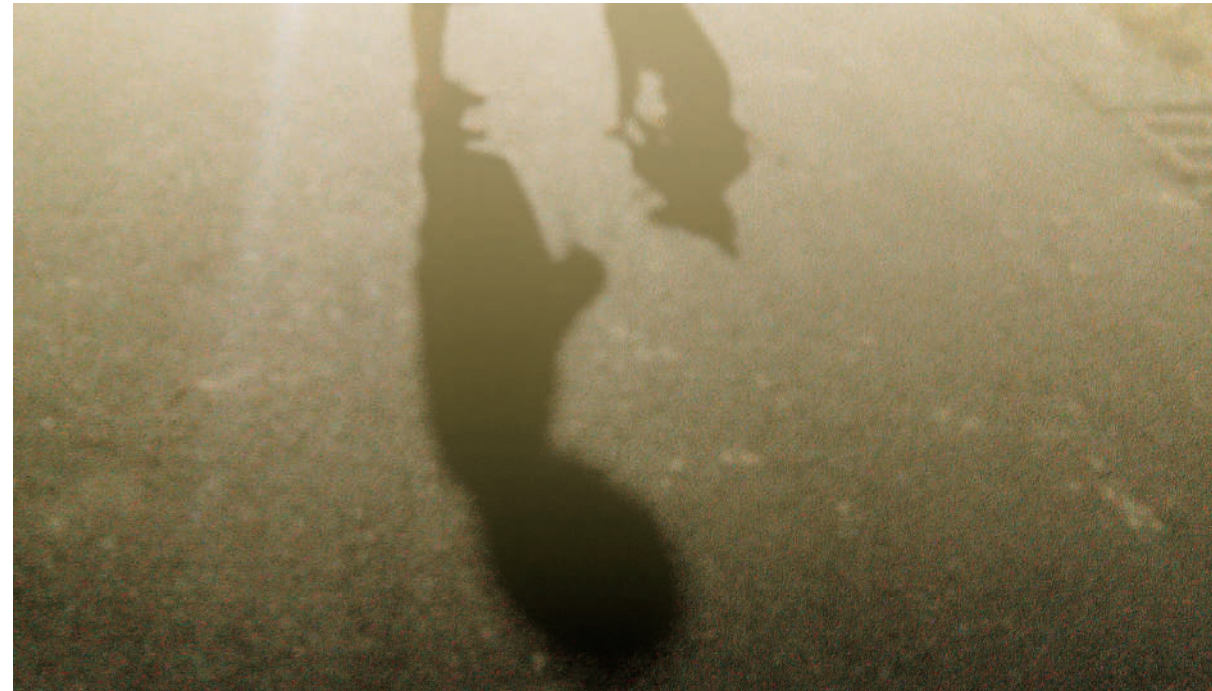
6. 溫暖 想死的決心，竟然在柔和的月光下，被一隻同樣悽慘的流浪狗，緩緩地撫平了。我們一語不發的對視彼此，在牠明亮的雙眼中，我看見自己懦弱的倒影。至少，至少啊，還有你。