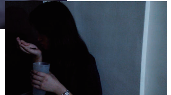
5. 吃吧 吃吧，也不過就幾顆藥丸罷了，若嘴裡短暫的苦澀可以將長久的疲累掃除，這麼一點點的犧牲又算的了什麼呢？