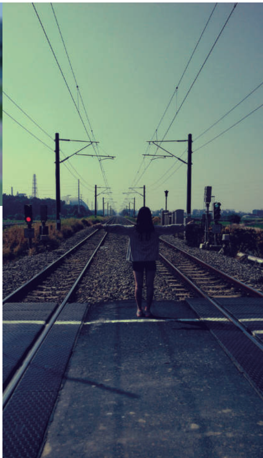
3. 來吧 來吧，即將靠站的火車，飛速前進的你肯定不會在乎站在這裡渺小的我的，我想閉上雙眼，好好享受那即將到來的解脫。