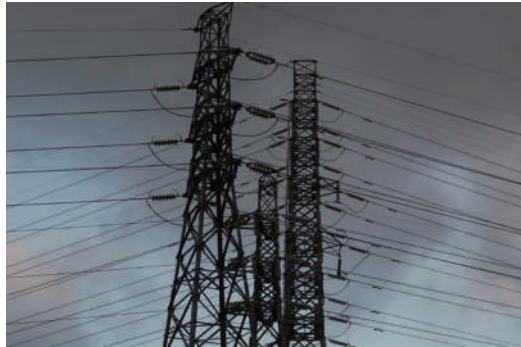
8. 群聚 我們又再度相遇，但很快地，我們又要即將離去。