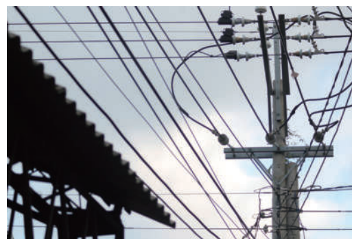
4. 交錯 沿著電線走，我又走到了一個抉擇的路口。