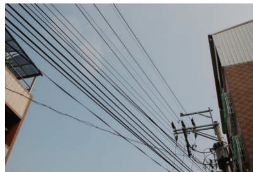
2. 線 陪著這些永無止境的黑線一起走，過了一條又一條的街道，這是我們大多數人都沒發現到的一件事。