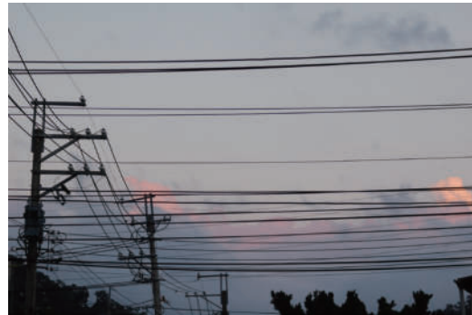
11. 橫線 如鐵道一般，迅速地穿越左右畫面。