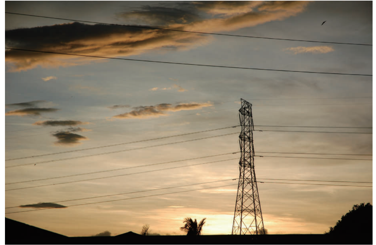
12. 繼續前進 黑藤蔓的生長，看似平凡，卻是複雜地令人難以置信。