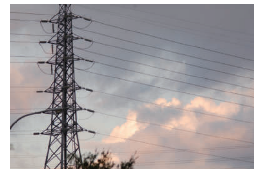
5. 主角 原來這就是養分的提供來源呀，雲朵們，你們有看見嗎？