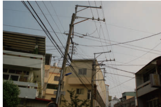
10. 思緒 別被巷子的的天空給影響了。