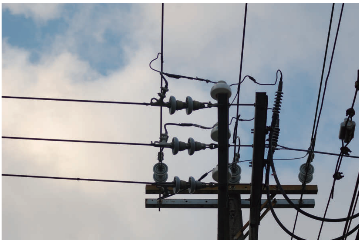
1. 我們的天空 當我抬頭看著天空時，我突然知道接下來我要做什麼了。

發聲動機： 我住在豐原，在假日時總喜歡騎著我的單車，帶著相機，在巷道中穿梭，拍下我覺得好看，總能讓我驚豔的景色，但當我抬頭向廣大的天空望去，一條條的黑線切割著我的視野，這城市中的黑藤蔓在我們頭頂上彼此交錯生長，互相纏繞，成為我們生活中習以為常，甚至是覺得醜陋的一部分。我很喜歡拍攝自然風景，有時我們總會避開人造的景物以免破壞整體氣氛，可憐的電線總是被排除在觀景窗之外，因此我想說，就來拍攝與電線有關的東西吧！於是在假日的不同時間點騎車拍攝，跟著電線走，而我發現通常店家較多的路段，電線看似比巷子中的雜亂程度較少，但事實上它們仍然存在，存在於騎樓之間或是招牌後方，最後連結於某一根電線桿，然後再向遠端繼續永無止境的生長，或許這些直線斜線真的再普通不過，但它們或多或少已成為我們生活中不可或缺的一部份，儘管並不是那麼的美，所以，美麗的雲朵和天空，就請你們暫時委屈一下，成為電線的背景吧！