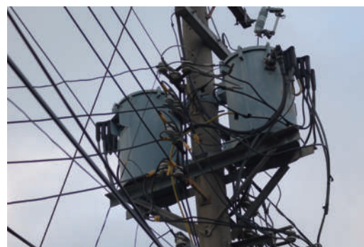
3. 果實 結實纍纍的果實，是經過風吹日曬雨淋之後的結晶。