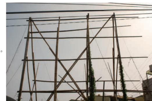
6. 瓜棚 和電線一樣直橫交錯，只可惜電線是不攀附在它上面的。