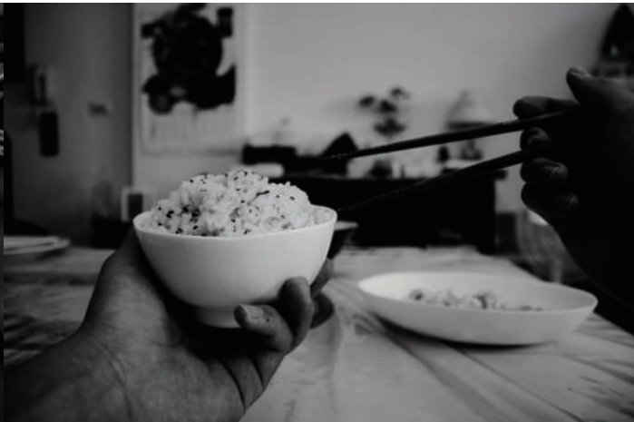
10. 吃飽 飽，飢腸的胃。