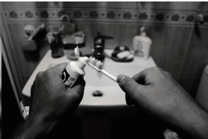
2. 刷牙 淨，一天的開始。