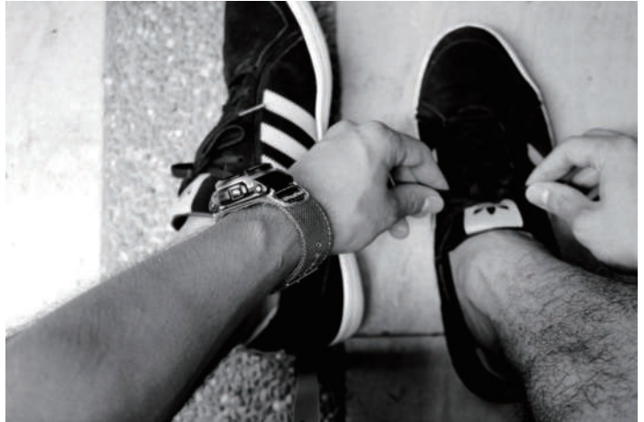
5. 繫鞋 繫上鞋帶，出發。