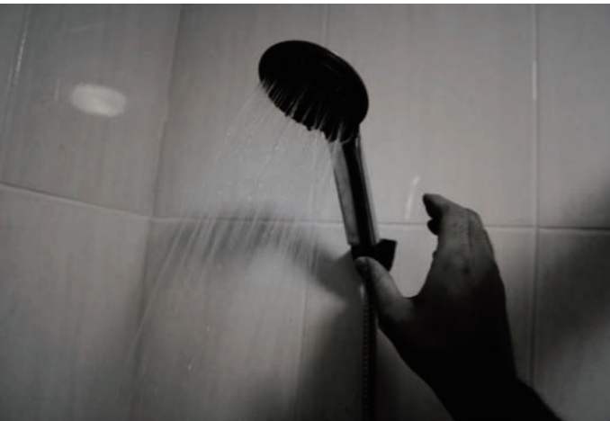
11. 洗澡 洗，一天的疲憊。