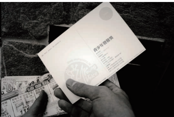
4. 發聲獎 「昨天，發生一件事。」