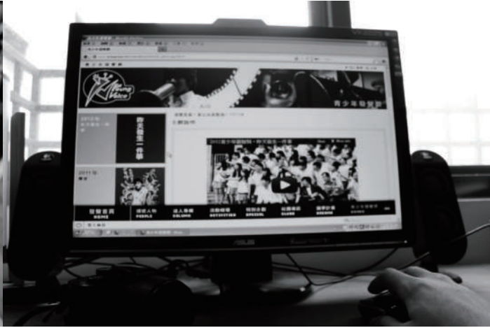
8. 上傳 發聲獎，參賽。