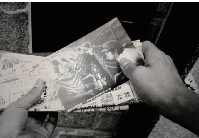
3. 信件 收件，發聲獎。