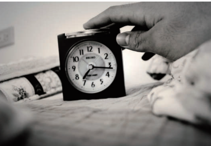
1. 起床 催醒，惱人的鬧鈴。

用第一人稱的視角來詮釋自己的一整天，也以黑白色相的風格作為昨天的象徵。作品內容是從一早起床按下惱人的鬧鐘作為一整天的開始，緊接著走進廁所刷牙洗臉準備迎接今天早晨。一早信箱裡發現一張特別的明信片，翻開來仔細一看才發現是「2012青少年發聲獎·昨天發生一件事」的徵件明信片，於是便興致勃勃的穿好衣服繫好鞋帶準備出門尋找攝影創作的題材，拿起相機拍攝自己拿手的景物特寫，沉浸在自己的攝影世界裡，回頭一看手錶才發現時間也已經不早了，趕緊完成作品上傳參賽。作為十七歲的高中生在追逐自己夢想的過程卻也不能忘記自己身為學生的本分，於是趕緊回到書桌攤開書本完成明天的作業。最後到了晚上，吃飽飯洗好澡，便也結束了這一天。