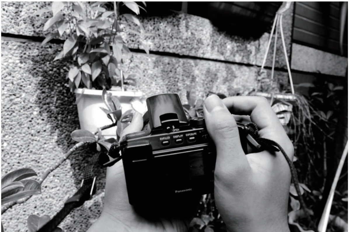
6. 拍攝 尋，不一樣的美好。