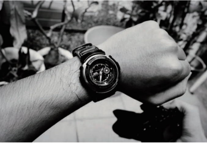
7. 看錶 晚了，時間。