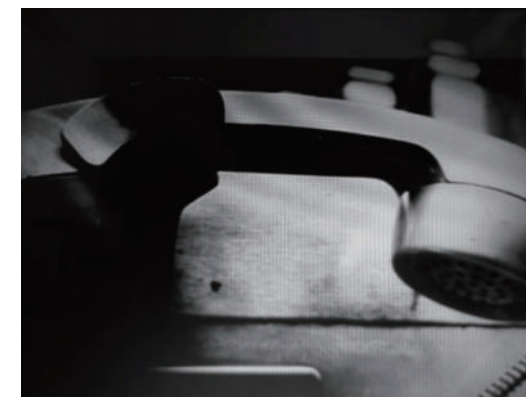
自己的聲音 每個地方的角落，都有這麼一個傳遞思念的聲音。