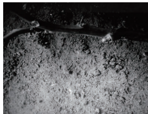
自然的聲音 再微弱的生命，都有宣示想活下去的權利。