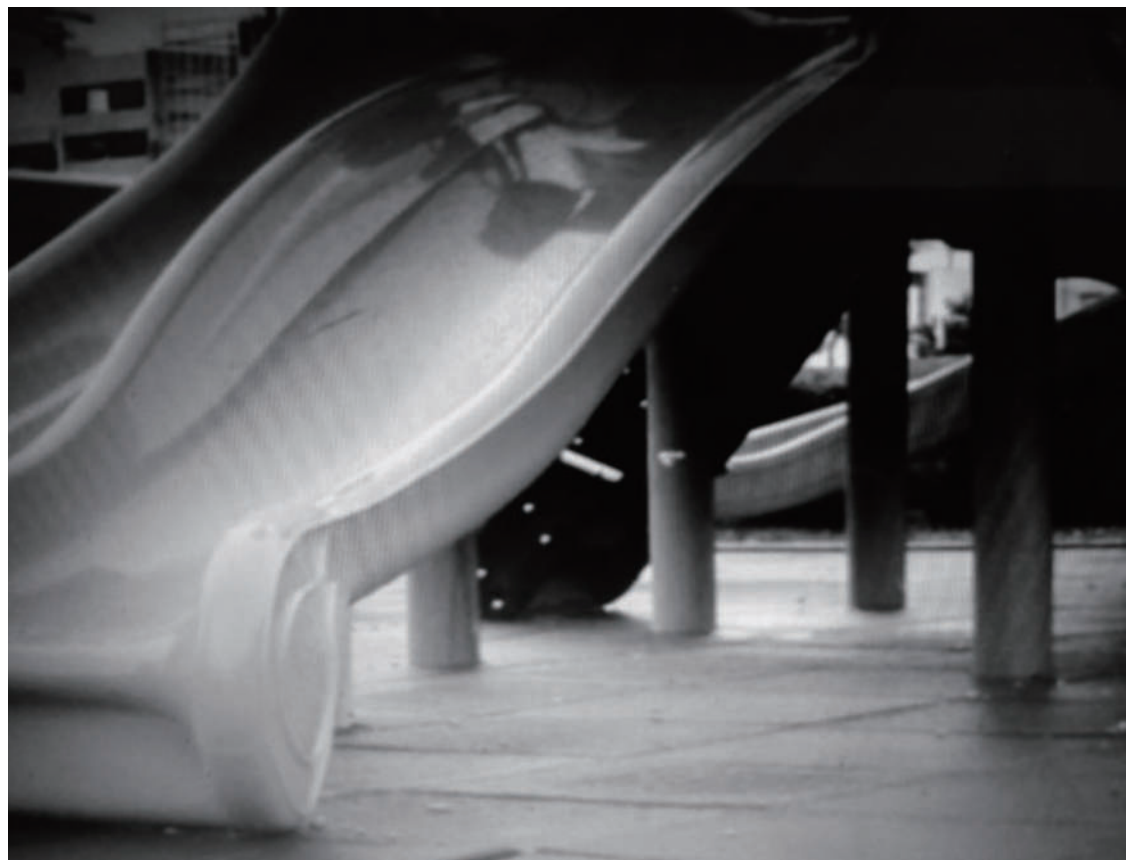
天籟的聲音 縱使孩子身影不在，但天籟般的笑聲卻不會消失。