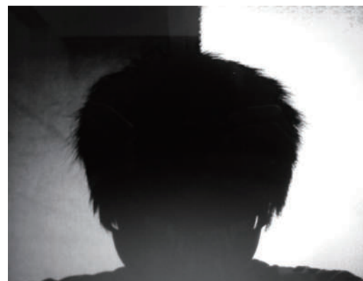
自己的聲音 從心靈之窗裡，到底還能看見多少內心的吶喊？