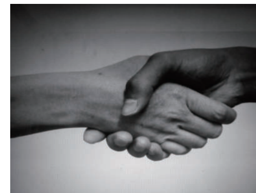
朋友的聲音 手心裡緊握的是，對彼此最真摯的承諾。