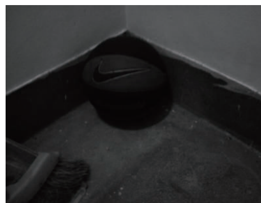
被遺忘的聲音 一顆放在角落的籃球，沒人聽得見它的哀愁。