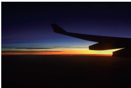
天籟的聲音 第一次和天那麼近，美的不是天，是我心底。