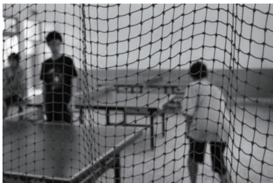
朋友的聲音 肩並肩，我們一起發出好球，打破眼前的困頓！