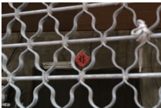
被遺忘的聲音 那從小就令每個人都雀躍的傳統，不可背棄。