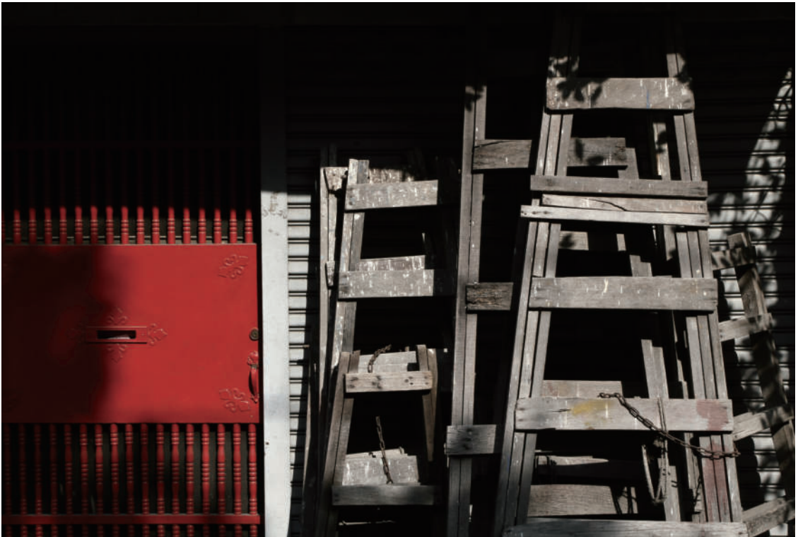
地方的聲音 豔紅門，古木梯，陽光打滾著。